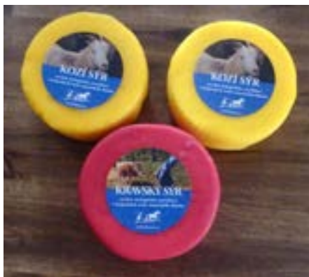
Gernik: sýry ve včelím vosku