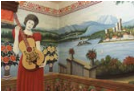
Bígr: obrazy