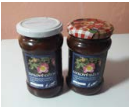
Rovensko: šípkový džem