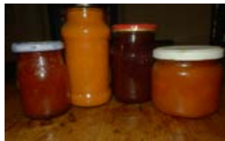
Gernik: marmelády a tzv. černidlo - marmeláda z chebđin