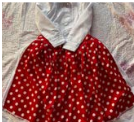
Svatá Helena: kroj