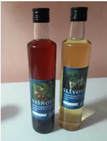
Rovensko: višňovka a slivovice