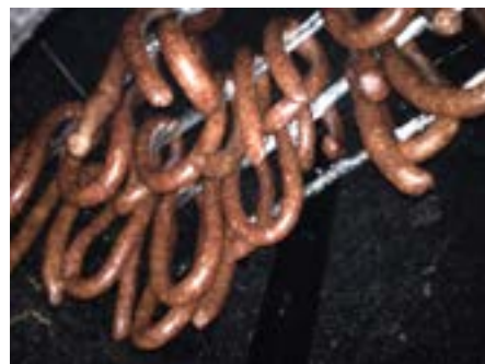
Svatá Helena: klobásy