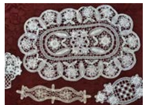
Eibenthal: háčkové ubrusy