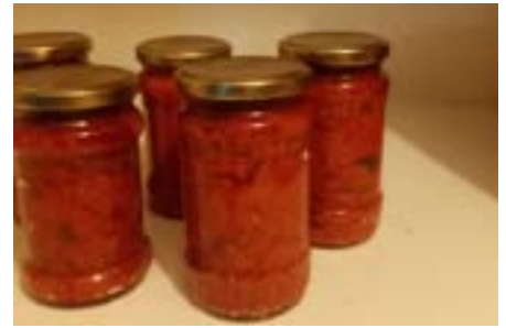
Svatá Helena: zakuska