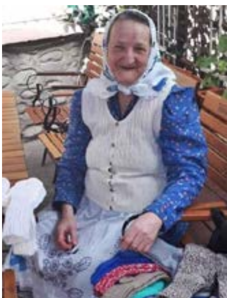
Šumice: vlněné fusekle