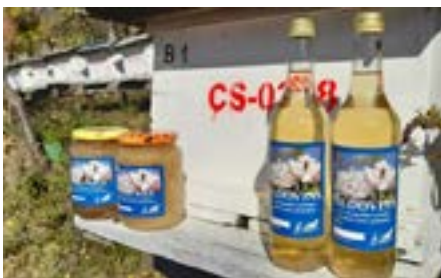
Gerník: med a medovina