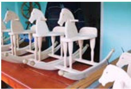
Eibenthal: dřevěné hračky