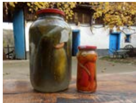
Gernik: nakládaná zelenina