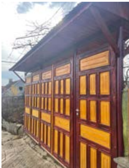
Gernik: truhlářské práce