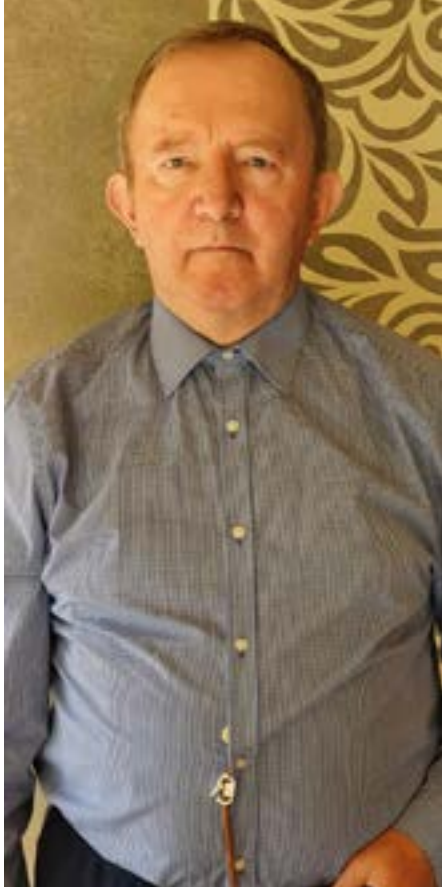
Portrét Václava Peca