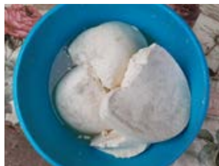
Svatá Helena: kozí sýr