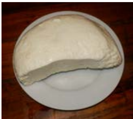
Gernik: tradiční sýr