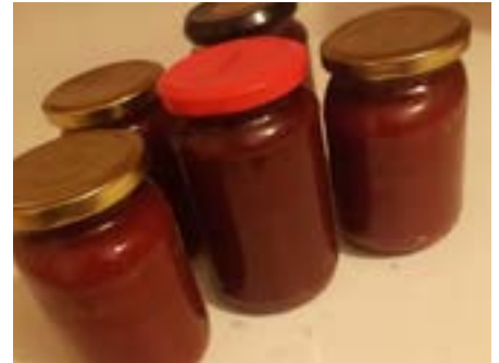
Svatá Helena: šípková marmeláda