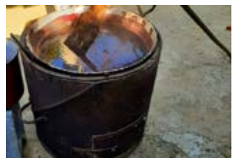
Svatá Helena: chebdinky