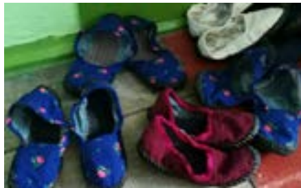
Gerník: bačkory s gumovou podrážkou