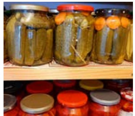
Svatá Helena: nakládaná zelenina