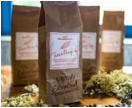
Eibenthal: bylinkové čaje