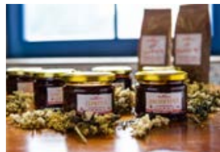
Eibenthal: povidla, marmelády, zakuska a chilli