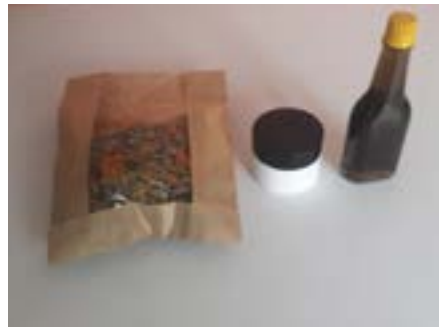
Rovensko: léčebné čaje, masti, tinktury