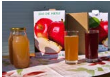
Eibenthal: ovocné mošty