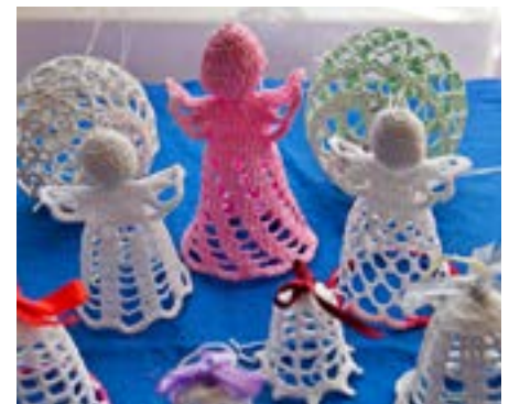
Eibenthal: vánoční háčkové ozdoby