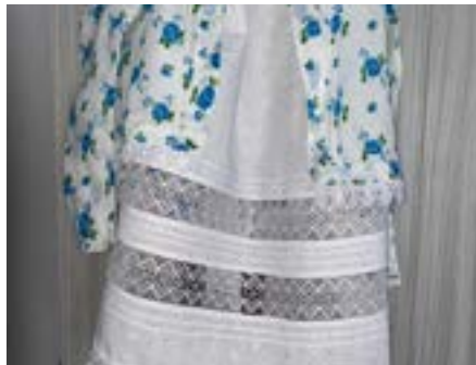
Gerník: tradiční kroj