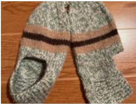
Svatá Helena: štrykování