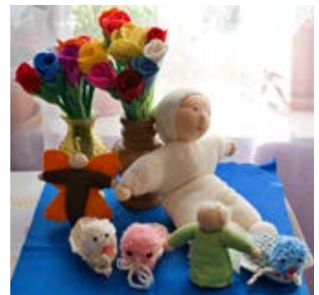
Eibenthal: šité hračky a další ozdoby