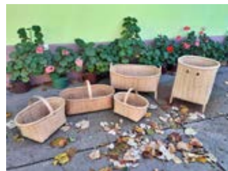
Šumice: koše a nůše