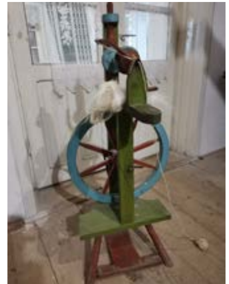
Gernik: předení vlny na kolovrátku