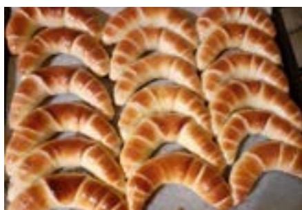
Svatá Helena: helenské rohlíčky