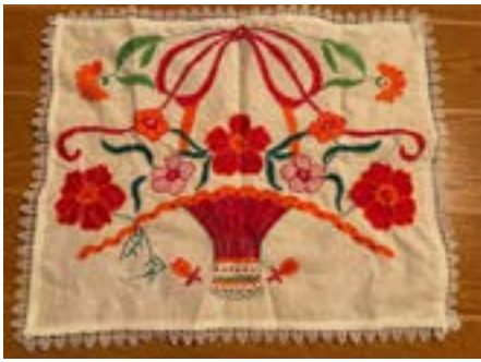
Svatá Helena: vyšívání