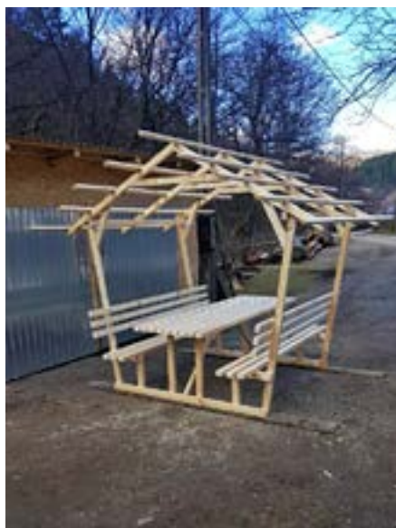
Šumice: dřevěný nábytek

Milí čtenáři, na následujících stranách najdete fotografie a popis některých tradičních i novějších produktů, které se dnes na českých vesnicích vyrábí. Seznam není úplný. Budeme rádi, když nám napíšete, co v něm chybí. Například sýry se vyrábí na všech českých vesnicích, nemáme ale pochopitelně fotografie od všech výrobců. Cílem tohoto soupisu je zejména inspirovat mladé, aby se chopili příležitosti, jak poctivou prací zajistit živobytí sobě i své rodině a zachovat v Českém Banátu tradiční řemesla. ●