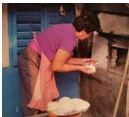
Gernik: chleba z pece